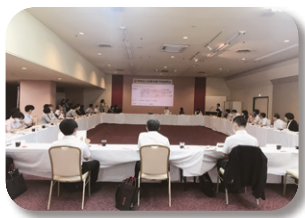
▲ 4学科の紹介をしている様子

6月5日（金）に、学校説明会を開催しました。県内の各高校から多くの先生方にご参加いただき、無事終えることが出来ました。 4学科の紹介や入試についての説明、質疑応答などを行い、説明会で説明した学生は、学校生活の様子や、授業に取り組んでいる事などを発表しました。 様々な感想やご意見をいただき、大変有意義な時間になりました。ご出席の先生方、お忙しい中お越しいただき、ありがとうございました。